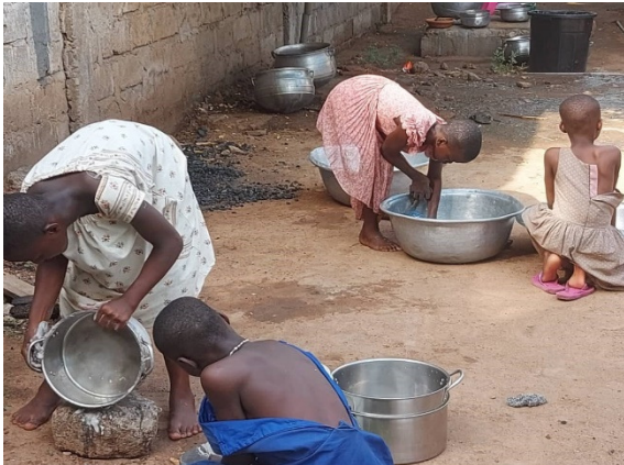
Küchendienst im CCD